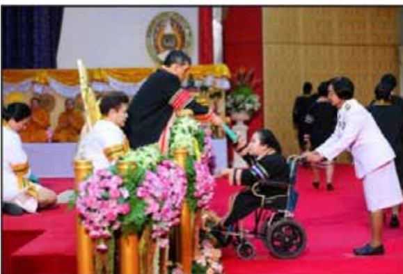
บัณฑิตที่บกพร่องทางการเคลื่อนไหว