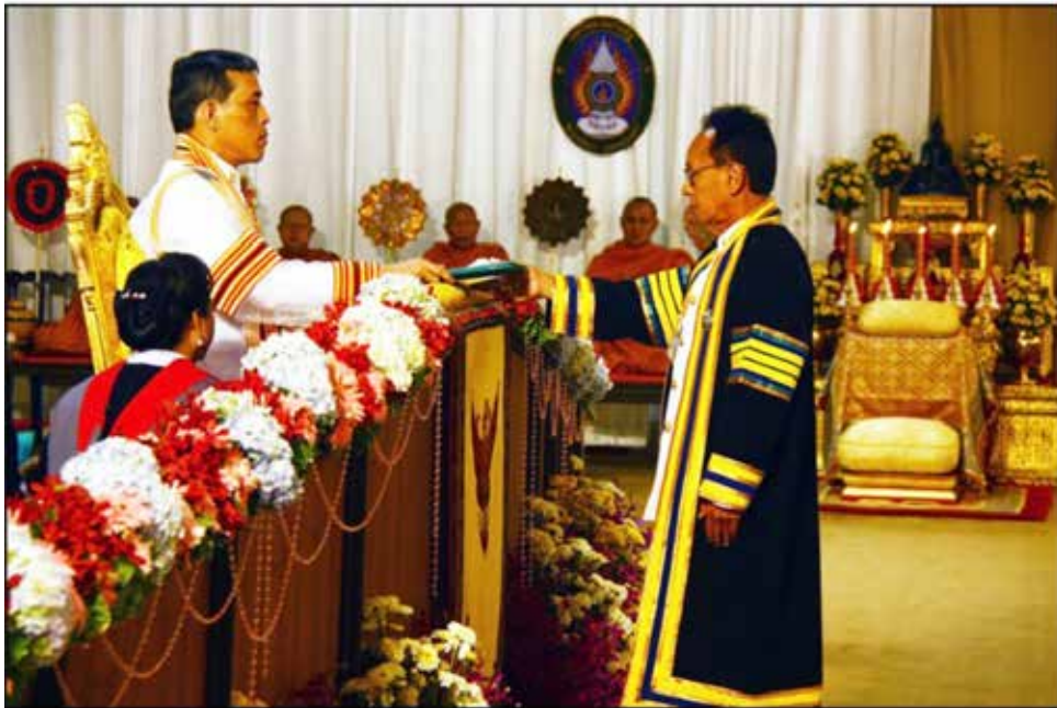
ยืนตรง หน้าตรง ทำชิต แขนแนบลำตัว