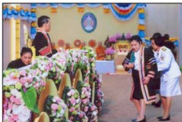
บัณฑิตที่บกพร่องทางการเคลื่อนไหว