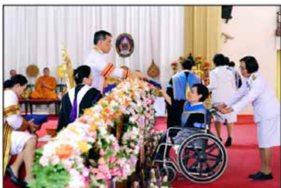
บัณฑิตนั่งรถเข็น