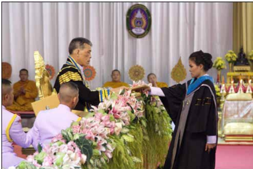
ยืนตรง หน้าตรง ทำชิต แขนแนบลำตัว