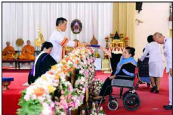
บัณฑิตนั่งรถเข็น